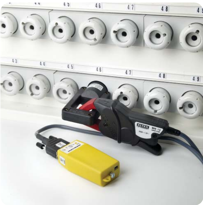
Illustrerar montering av Mätman EnergiAnalysis i mätarskåpet.

Mätman XL - Programvaran gör det enkelt att hantera mätningarna och göra överskådliga presentationer.