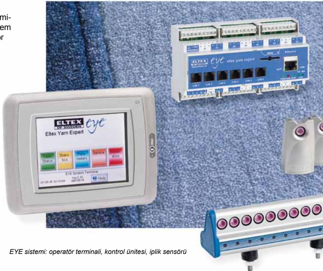
EYE sistemi: operatör terminali, kontrol ünitesi, iplik sensörü