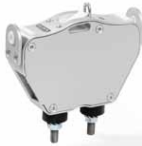
Atkı dokunması sırasında iplik tansiyonu ETM Atkı Tansiyon Monitörü

Bu yeni geliştirilen Atkı Tansiyon Monitörü dokuma teknolojisinde küçük bir devrim niteliğindedir. Dokumadaki verimi arttırmak ve geniş uygulama alanındaki kumaş kalitesini arttırmak adına, önemli bir adım atmayı mümkün kılar.